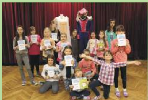
26-30.01.2015 Zimowe spotkania z folklorem