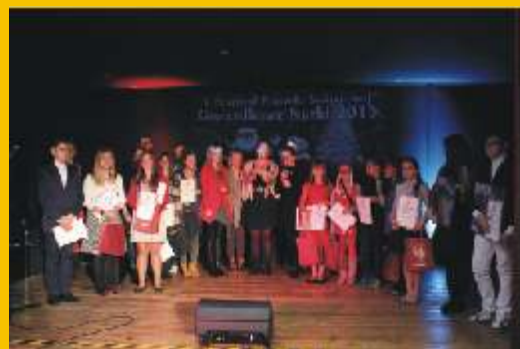
06.12.2015. V Festiwal Piosenki w Tęczowej „Gwiazdkowe Nutki”