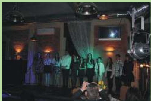
20.03.2015 Koncert Studia Wokalnego ROK