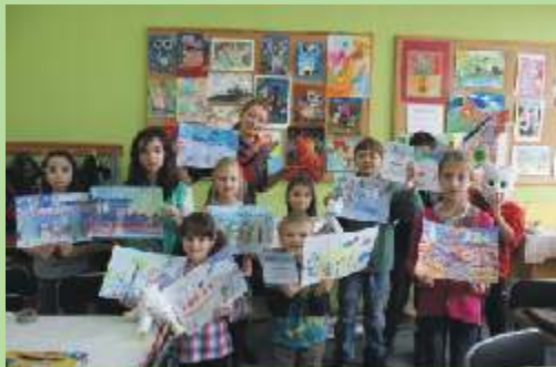
26-30.01.2015. Zimowe Warsztaty Plastyczne.