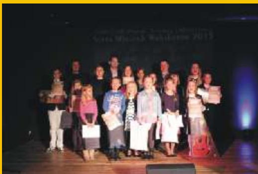
27-28.11.2015. XXIII Giełda Piosenki Dziecięcej i Młodzieżowej