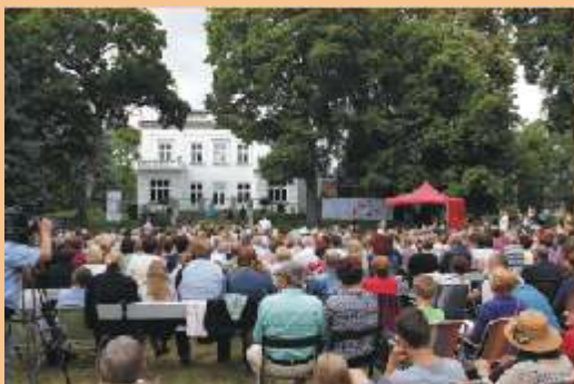
28.06-12.07.2015 XXII Festiwal Muzyczne Dni Drozdowo-Łom a