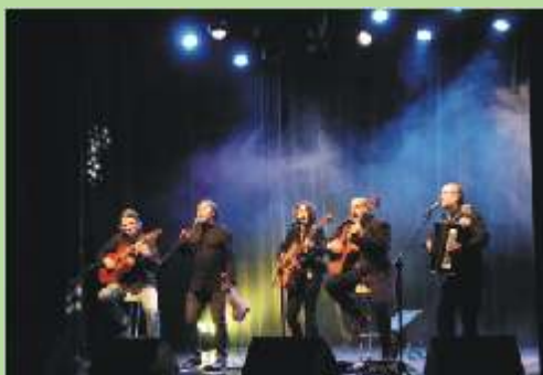
13.02.2015 Koncert zespołu Dzie Dobry