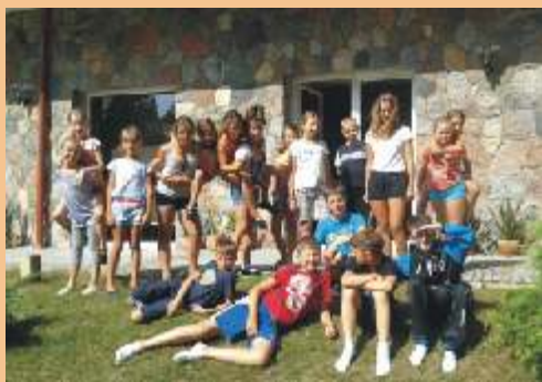
10-16.08.2014 Warsztaty ZPiT „Łom a” w Proserwach