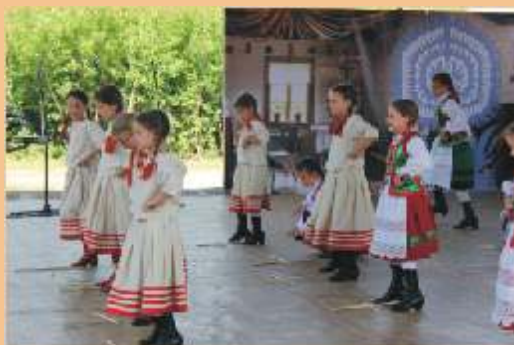
14.06.2015. XXII Ogólnopolskie Dni Kultury Kurpiowskiej w Nowogrodzie