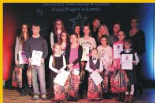
06.12.2015. Konkurs Plastyczny „Łomyskie Tradycje Bożonarodzeniowe”