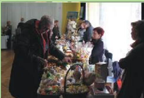
22.03.2015 Łom y ski Jarmark Wielkanocny -Targi Twórczo ci Artystycznej 2015