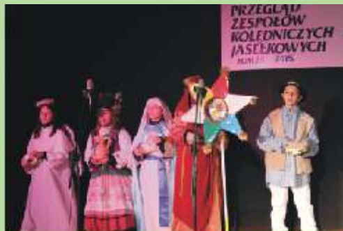
17.01.2015 Przejąd Zespołów Kolędniczych i Jasełkowych