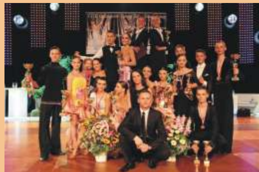
7.11.2015 XIX O.T.T.T o „Puchar Marszałka Województwa Podlaskiego, Starosty Łom yskiego i Prezydenta Miasta Łom a”