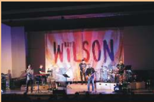
28.04.2015 Koncert Ray Wilson Genesis Classic