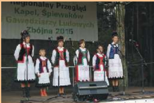
17.05.2015 Regionalny Przegląd Kapel, śpiewaków i Gawędziarzy Ludowych