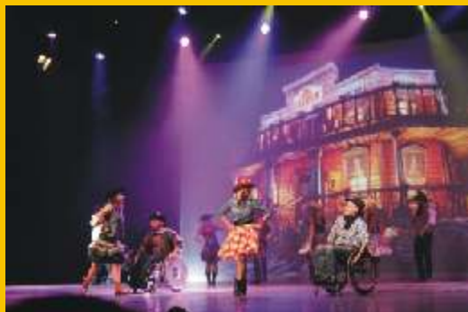
20-25.11.2015 Występ grupy „Tacy sami” w Tours we Francji.