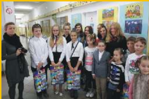
23.10.2015. Recepta na zdrowe życie - wernisa